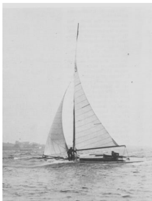
"Gækken" under sejladsen i 1938

Vi inviterer hermed alle sejlere i Danmark og det øvrige Europa til Danmarks ældste kapsejlad, der har været afholdt siden 1934.